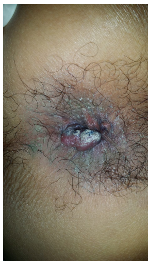
7 月 18 日

初診時脈弦緩，苔黃薄，開給真人活命飲 8 克消腫，腸胃散 6 克在調整腸胃機能，讓其排便功能順暢，並給予灌黑藥膏外敷。7 月 24 日複診痔腫稍消，藥同，再灌藥一次，8 月 1 日痔消更多，又服同樣的藥，也再灌藥一次，同時拿一瓶藥膏自己敷，進部情形如下：