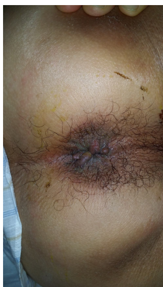
8 月 1 日