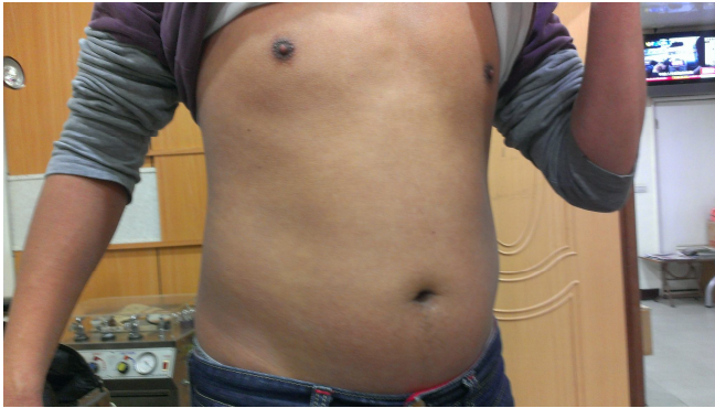
癒後皮膚恢復正常 1/19 日照